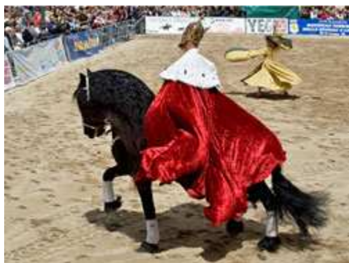
La rappresentanza 2009 della Regione Sicilia

“ A Leonessa uno spettacolo che ama i cavalli ”