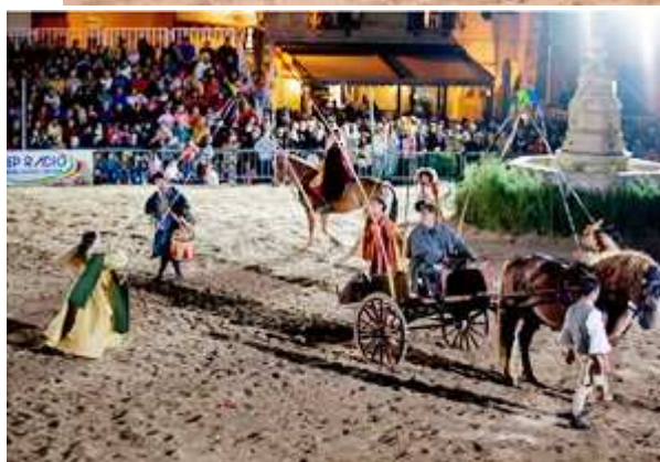
SARDEGNA2 - 1°classificata