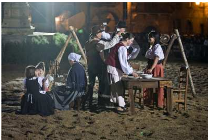
Campania - Terza classificata 2009

Non è raro, infatti, che i diversi gruppi, dopo la partecipazione a Leonessa, siano ospitati dalle più importanti manifestazioni di settore italiane ed europee.