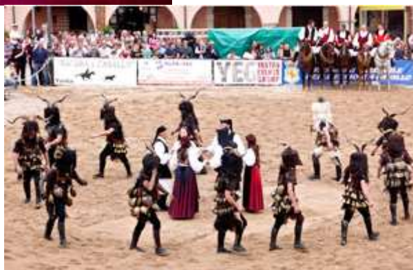
SARDEGNA - 1°classificata