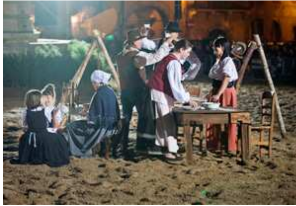
SICILIA - 2° classificata CAMPANIA - 3° classificata

Torna la magia del teatro equestre sotto le stelle. Una magia che si ripete anno dopo anno, regalando un'emozione sempre diversa.