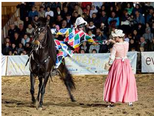
La rappresentanza della Regione Veneto

“ Dal 18 al 20 giugno in Piazza VII Aprile torna la magia di cavalli e cavalieri ”