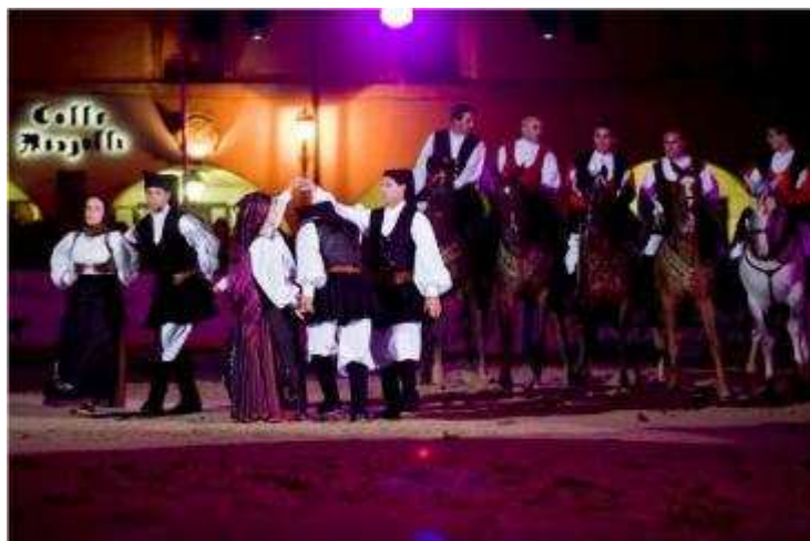
La 'Rassegna nazionale regioni a cavallo'

La manifestazione, ormai molto nota, richiama ogni anno un gran numero di partecipanti