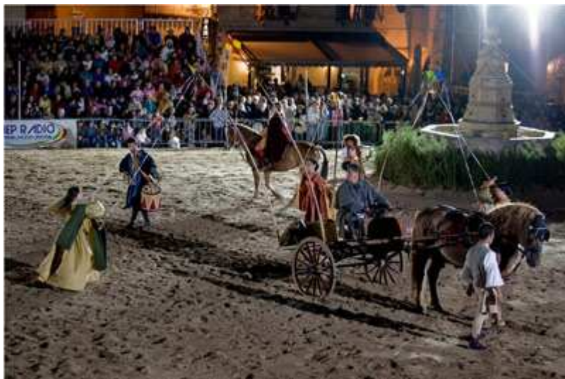
Sicilia - Seconda classificata 2009

L'estrema cura con cui viene messo a punto ogni dettaglio organizzativo, l'attenta e complessa regia dello spettacolo, gli importanti contenuti portati in scena e il grande successo di pubblico e critica, hanno reso la manifestazione ideata dalla Yeg un palcoscenico sempre più ambito da chi si occupa di teatro equestre. Oltre che una vetrina di prestigio.