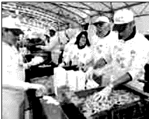
La preparazione delle patate per la sagra leonessana